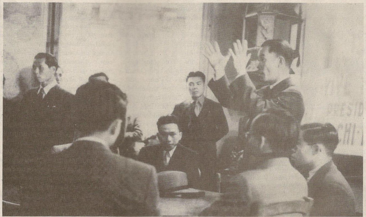
Đại biểu lính thợ mít tinh chào mừng Chủ tịch Hồ Chí Minh đến Pháp năm 1946

Pháp. Dĩ nhiên, tất cả những yêu cầu giải thể nha MOI, hồi hương hay các hình thức đấu tranh đòi độc lập đều bị chính phủ de Gaulle phớt lờ.