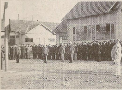
Một trại lính thợ ở Venissieux, miền Nam nước Pháp, 1943

tình hình thời sự nổi cộm của đời sống xã hội Pháp trong những năm gần đây là tình trạng nhập cư lao động. Lông trong bối cảnh này là một dự luật năm 2005 (nhưng sớm bị bãi bỏ) về việc công nhận những hệ quả tích cực của chế độ thực dân Pháp. Giới trí thức Pháp, đặc biệt là giới sử học, dựng nên những bức tranh sáng tối về hành trình lao động nhập cư đến từ nhiều quốc gia và thể chế chính trị khác nhau trong thế kỷ XX đem lại một phân đàng kể cho sự phát triển kinh tế của nước Pháp, nhưng ngày nay nó cũng để lại nhiều hệ quả về xã hội, chính trị gây đau đầu cho chính phủ. Trong dòng lịch sử này, không thể thiếu một xứ Viễn Đông thuộc địa xa xôi, nhưng chỉ từ khi cuốn Nhân công Đông Dương, lao động nhập cư cưỡng bức (1939 - 1952) (4) ra mắt từ tháng 5-2009 thì công luận mới được đọc một bản cáo trạng tổng thể và chi tiết về sự khai thác nhân công thuộc địa ngay trên “chính quốc”.