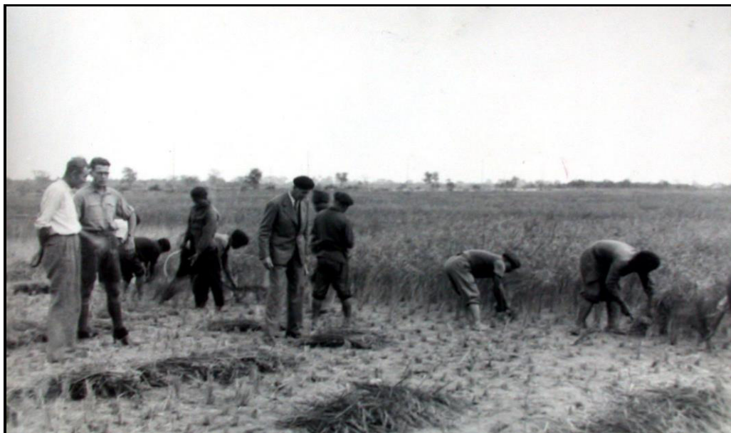
Pin Fourcat : Récolte du riz – Parcelle 1

Enfin, les changements de Direction (quatre personnes en 3 ans furent responsables de ce service et donc imposèrent leurs idées), ne permirent pas l'exécution d'un plan continu qui eut assuré le succès.