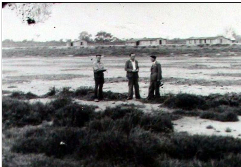
Pin Fourcat : État des parcelles avant défrichage – Vue du camp