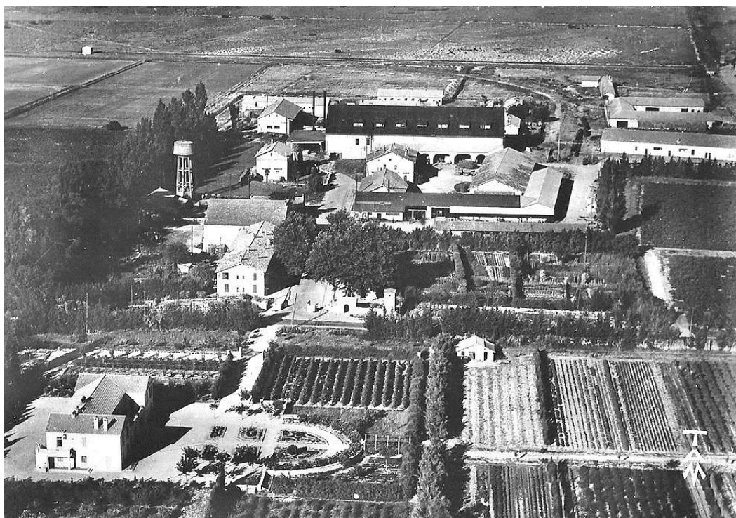
Domaine de Boisviel